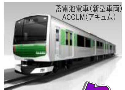
蓄電池電車(新型車両) ACCUM(アキュム)