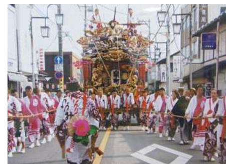
彫刻も美しい大屋台（山車）

大きなスクリーンで実際の山あげ祭のドキュメント、那須烏山市の紹介映像を上映します。迫力満点！