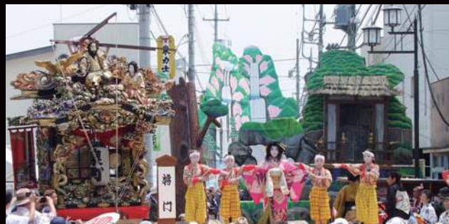
常磐津所作「将門」の一場面