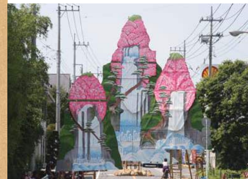
烏山和紙で作られたはりか山。 手前から 前山…高さ約5m 中山…高さ約7m 大山…高さ約10m