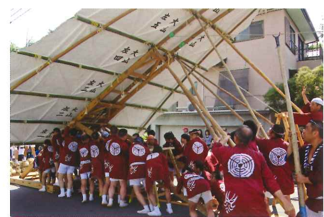
大山を上げる若衆たち