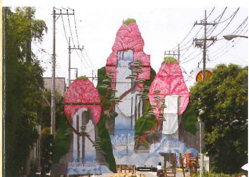
烏山和紙で作られたはりか山。 手前から 前山…高さ約5m 中山…高さ約7m 大山…高さ約10m