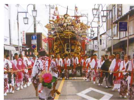
彫刻も美しい大屋台(山車)

450年以上の歴史を誇る、絢爛豪華な野外劇。 観客の前に、道路上100mにも及ぶ舞台が設置されます。 烏山和紙を使った背景の「はりか山」(大山、中山、前山)や館、橋、波などが配置され、舞台の進行に伴い様々に変化します。 若衆達の一糸乱れぬ妙技と、踊り娘達の常磐津の三味線にあわせた美しい舞は、一見の価値あり！ 毎年7月の第4土曜日を含む金、土、日に開催されます。