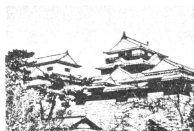
松山や秋より高き天守閣 子規句